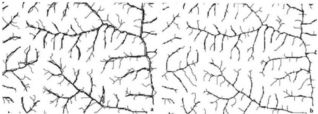
图 2 DEM 对流水线的提取结果